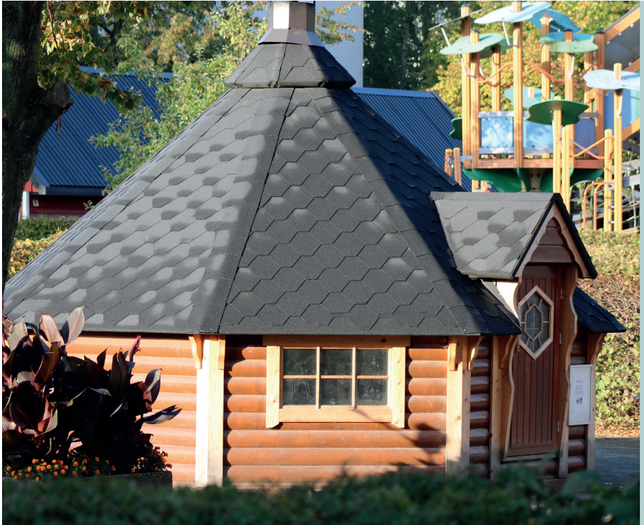
Bagehytten midt i Hedemarken, 2020