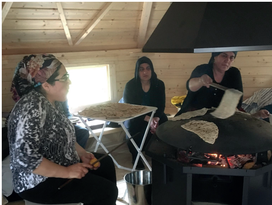
Der bages tyrkisk gözleme af beboere fra Hedemarken. Bagehytten, 2021 side 24

Du finder foreningsguiden på www.hedemarken.dk/boligsocial