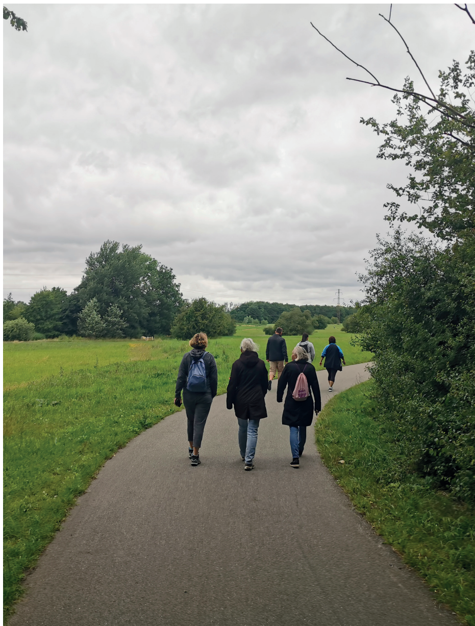
Vandretur ud i det grønne. Hedemarken i bevægelse, 2020