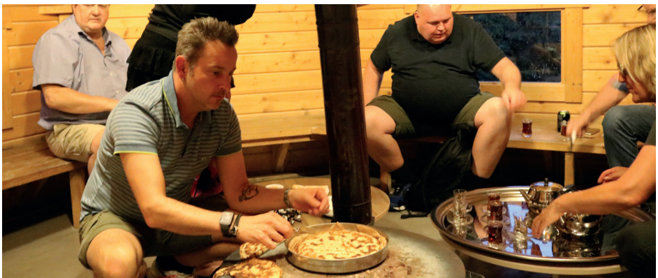
Der varmes pandekager i bagehytten af beboere fra Hedemarken, 2021