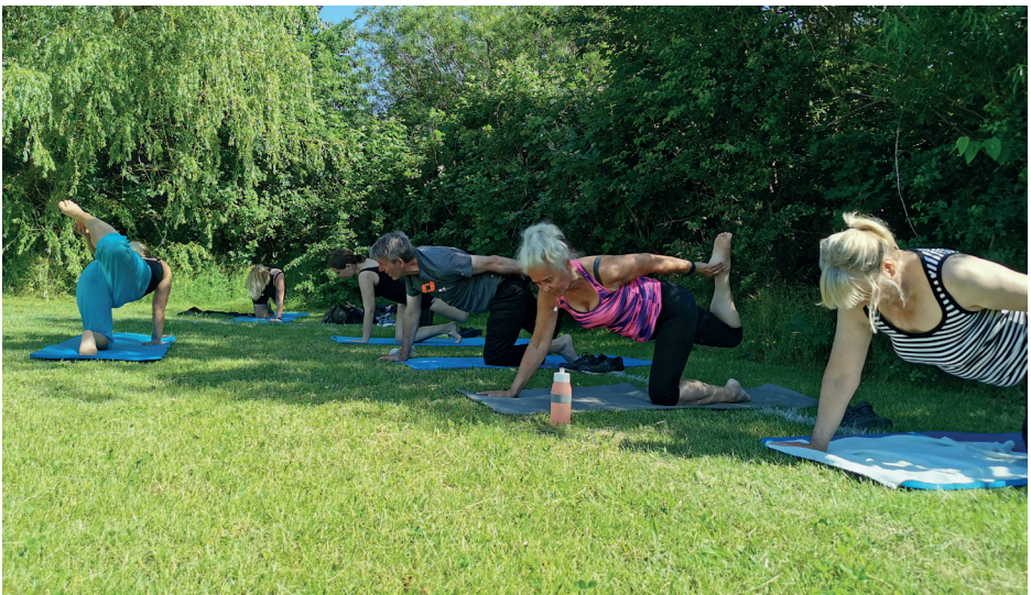
Yoga hold på græs, Hedemarken i Bevægelse, 2020