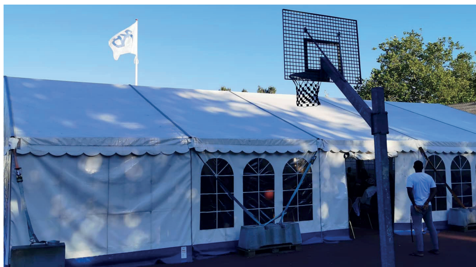
Afdelingsmøde i en coronatid. Den Røde Plads, 2020