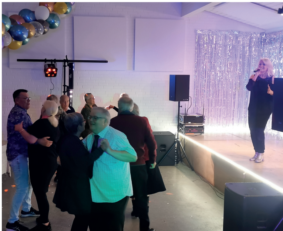
Frivilligfejring med Melodi grandprix tema. Festsalen, 2021

Vil du gerne vide mere om foreningstyper og registrering, kan du downloade HINTs pjece om dette fra www.hedemarken.dk/boligsocial